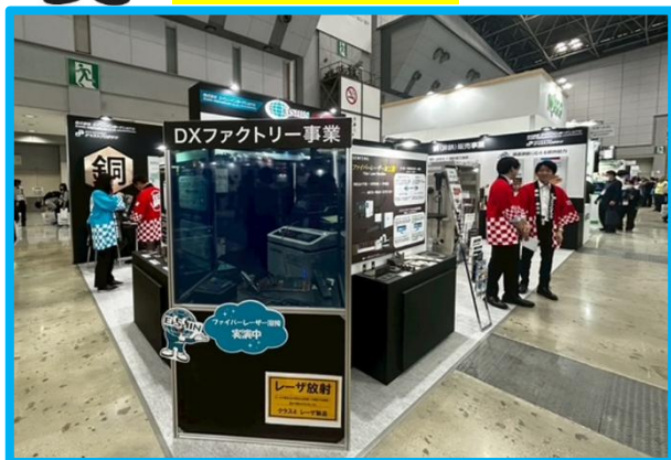
～レーザー加工機実演～