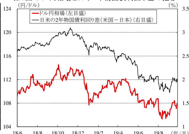
第3図: ドル円相場と日米2年物国債利回り差の推移

(注) 網掛け部分は、ハト派化した中央銀行。 (資料) 各国中央銀行、Bloombergより三菱UFJ銀行経済調査室作成